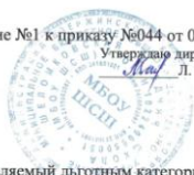
График выдачи продуктов, единовременно предоставляемый льготным категориям МБОУ Шеломковская СПЗ взамен обеспечения бесплатным горячим питанием