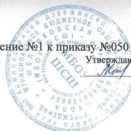
График выдачи продуктов, единовременно предоставляемый льготным категориям МБОУ Шеломковская СПШ взамен обеспечения бесплатным горячим питанием